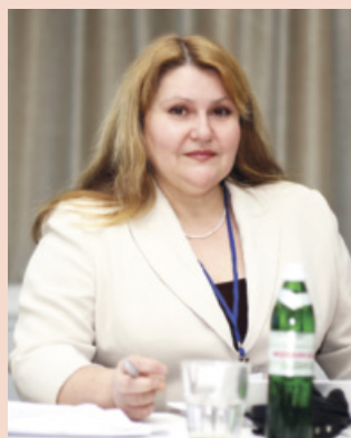
■ Наталія Романова, президент Палати Регіонів Конгресу місцевих і регіональних рад Ради Європи

Втілення в життя реформи місцевого самоврядування та територіальної організації влади в Україні дозволить забезпечити однакові держані стандарти громадян нашої держави, незалежно від того, де вони проживають. Це дасть поштовх до розмежування повноважень між рівнями влади на користь місцевих органів самоврядування.