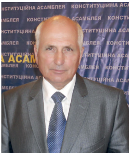
■ Микола Фурсенко

– Миколо Івановичу, 21 червня на черговому засіданні Конституційної Асамблеї обговорювали проект Концепції змін до Конституції. Навіщо українцям змінювати Конституцію?