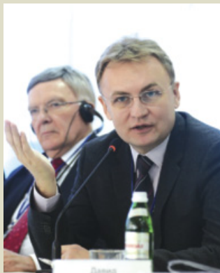
■ Андрій Садовий, міський голова Львова

Криза – це те слово, яке найчастіше звучить останнім часом в Європі і в Україні. Криза економічна, політична, суспільна. Такі явища не вперше відбуваються в світі. Найбільш кризовими були середні віки. Що тоді зробили далекоглядні володарі країн? Як відреагували на цей виклик? Вони передали максимальну повноту влади містам, започаткувавши практику Магдебурзького права. І міста почали підніматися, піднімаючи за собою свої країни. Це повчальний приклад, і мені дуже приємно, що в світі це дуже добре розуміють. Серед них і Україна задекларувала свій рух в напрямку цінностей місцевого самоврядування і підтвердила свої наміри в 2009 році в Утрехті, підписавши Утрехтську декларацію