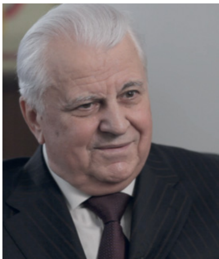
■ Леонід Кравчук

«Конституційна реформа має стати договором між народом і владою. Нам потрібно модернізувати Конституцію. Це повинен бути договір між народом і владою, зміни, у які повірять», – про це заявив перший Президент України, голова Конституційної Асамблеї Леонід Кравчук.