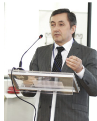
■ Валерій П'ятак, в. о. голови Львівської обласної ради, заступник голови Львівської обласної ради

2013 рік Європейським Союзом оголошений роком участі громадян. У нас є можливість подумати, куди ми рухаємося, та спланувати наші дії, яким чином побудувати свій стратегічний план і як зробити так, щоб наші завдання на кожному етапі були досягнуті.