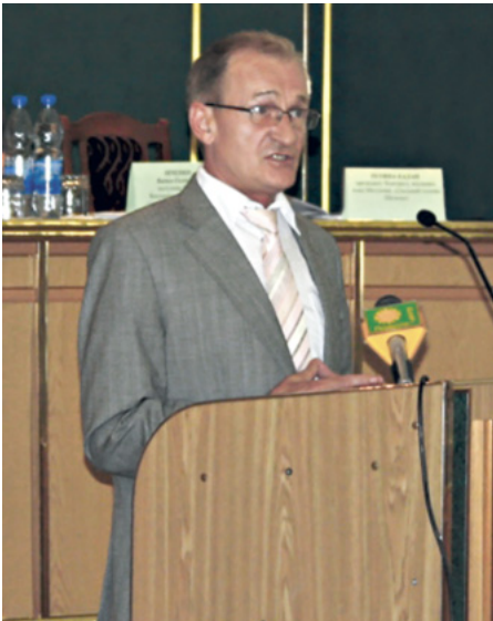
■ Микола Дерикот, голова Хмельницької обласної ради

Микола Дерикот, поза будь-яким сумнівом, є рушієм громадських ініціатив на Хмельниччині. Він одним з перших започаткував громадські слухання, коли у Верховній Раді зайшла мова про продаж земель сільськогосподарського призначення. Він збирав сільських і селищних голів, об'єднував їх в єдине ціле, прохав кожну з громад висловити власну точку зору, аби потім з конкретними пропозиціями достукатися до волевиявлення парламентарів.