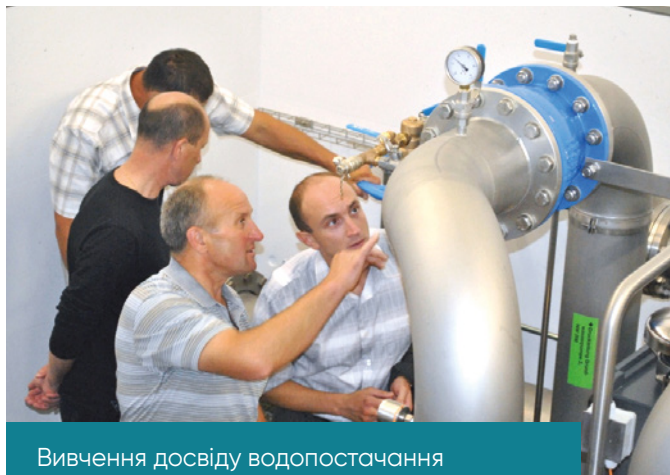
Вивчення досвіду водопостачання у Швейцарії, червень 2011 р.