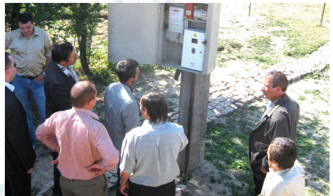
Ознайомлення з досвідом утримання та обслуговування системи водопостачання, Гушчинці, 2009.

Зі зміною влади країни у 2010 році, відбувся драматичний зсув назад до централізованої моделі управління та стагнації здійснених ініціатив. Проект DESPRO знову адаптував підхід: зосередився на місцевому рівні і демонстрував переваги децентралізованого надання послуг, створюючи попит на реформу “знизу”.