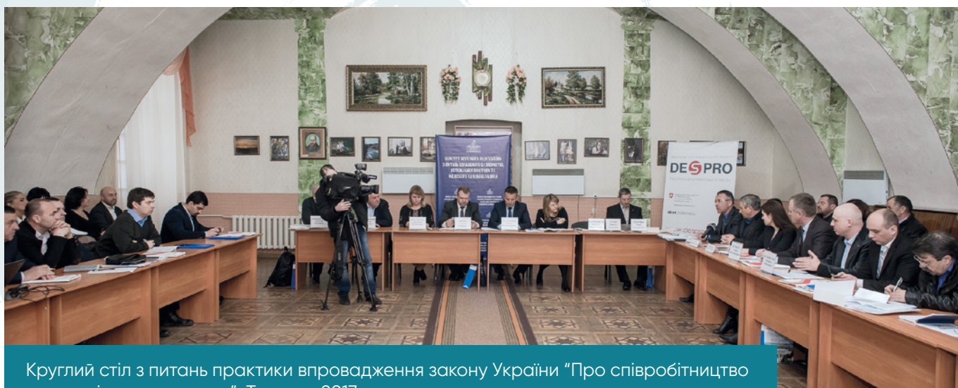
Круглий стіл з питань практики впровадження закону України "Про співробітництво територіальних громад", Тульчин, 2017 р.

“Я зрозуміла, що моя місія комунікатора повинна ще більше розвинутиися, що нам потрібно використовувати нові форми спілкування. Ми спільно з DESPRO запровадили виїзди депутатів на місця з просвітницькою та роз'яснювальною метою. Ми обговорювали, серед іншого, що відбувається з реформою, на якій стадії цей процес, які подальші виклики, які питання треба закрити на законодавчому рівні, які ризики прийняття змін до Конституції тощо.