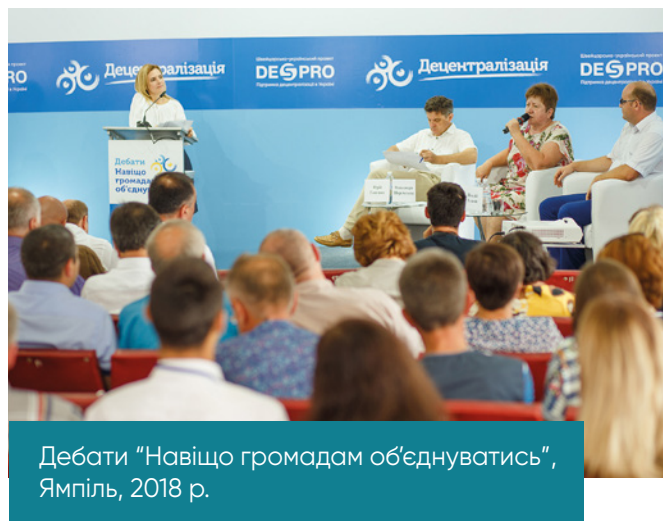
Дебати "Навіщо громадам об'єднуватись", Ямпіль, 2018 р.

У цей час, незважаючи на те, що DESPRO уже не був найбільшим проектом міжнародної технічної допомоги у сфері децентралізації, на національному рівні DESPRO продовжив тісне партнерство із Урядом України завдяки своїй гнучкості та проактивності. DESPRO і надалі отримував запити від Уряду щодо допомоги у найнеобхідніших та базових напрямках втілення реформи місцевого самоврядування: комунікаційна підтримка реформ, законодавча експертиза, створення платформи з координації діяльності Уряду, Парламенту та ключових партнерів з упровадження реформи з децентралізації.