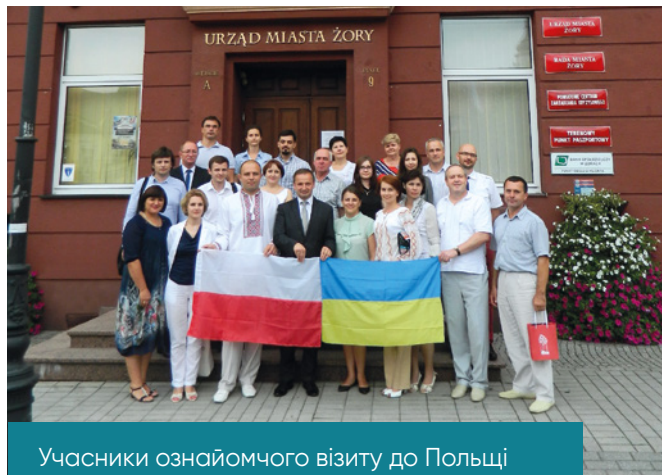
Учасники ознайомчого візиту до Польщі у м. Жори, липень 2015 р.