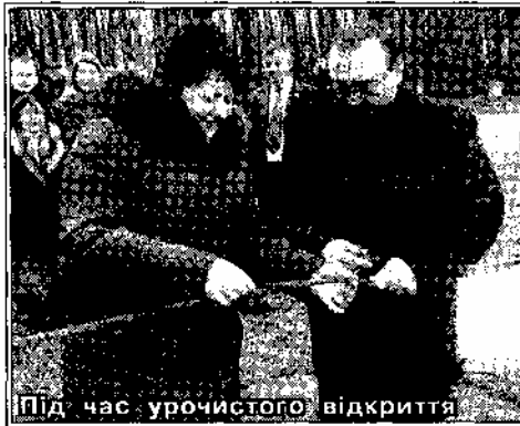
Під час урочистого відкриття

царсько-український проект Despro та самі мешканці села, які зібрали левову частку вартості побудови водогону — 257 тисяч гривень.