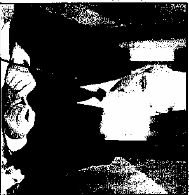
В интервью телеканалу Еuronews Лукашенко заявил, что кризис коснулся Белоруси, "ка-

Играли в финансовые пирамиды, не участвовали в фондовых спекулятивных операциях, мы не бросили свою экономику на Уолл-стрит. - Добавил Лукашенко. Он подчеркнул, что страна